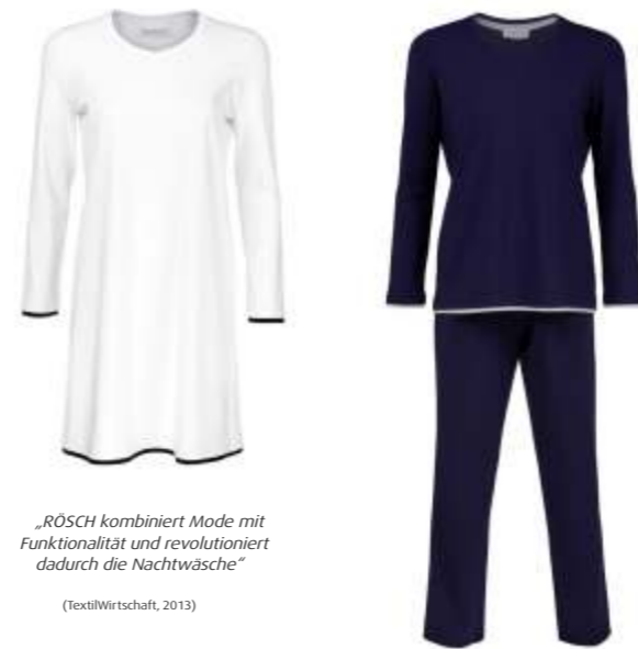
„RÖSCH kombiniert Mode mit Funktionalität und revolutioniert dadurch die Nachtwäsche“ (TextilWirtschaft, 2013)